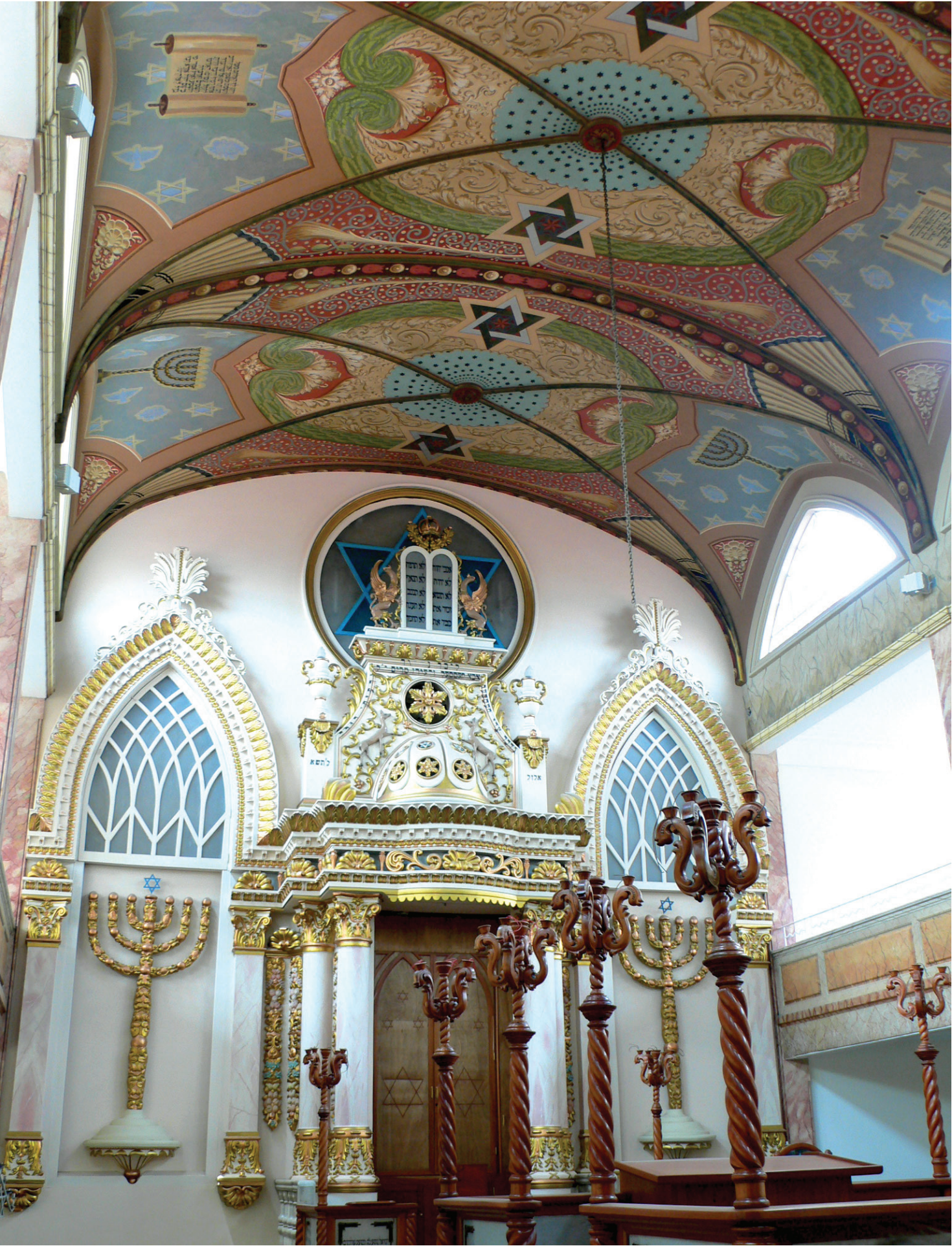
La Juderia de Jesús María y sus alrededores [ Mónica Unikel-Fasja ]